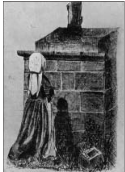
Bretonne en prière, dessin de Ropartz (1884)

Requiem pour soli, chœur et orchestre (1937-1938)