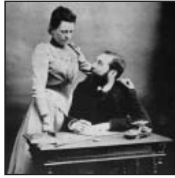
Ropartz et sa femme, 1892