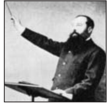
Au pupitre à Nancy